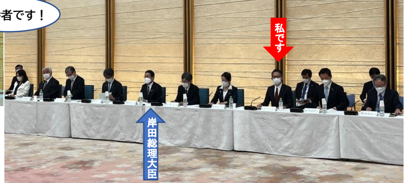
↑全国都道府県知事会議 総理懇談会（11月7日）