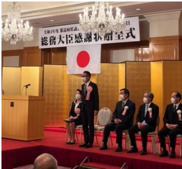
↑全国都道府県知事会議の閣僚懇談会にて司会を務める（11月7日） ←都道府県議会議員及び市区町村議会議員総務大臣感謝状贈呈式（10月24日）