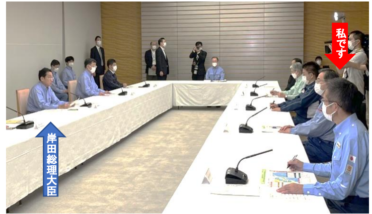
↑台風第14号に関する関係閣僚会議に出席（9月18日）総務大臣の代理として自治体の対応状況などの報告をしました。