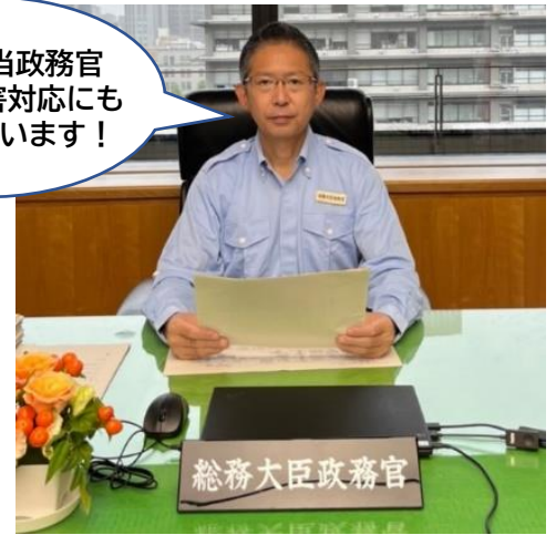
↑官邸から緊急連絡が入り、暴風雨の中を必死の思いで総務省政務官室に駆けつけました。